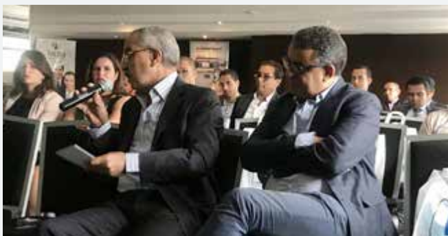
> Agadir <