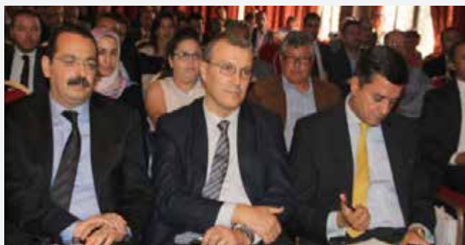
> Tanger <