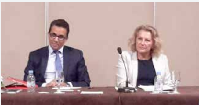
> Marrakech <