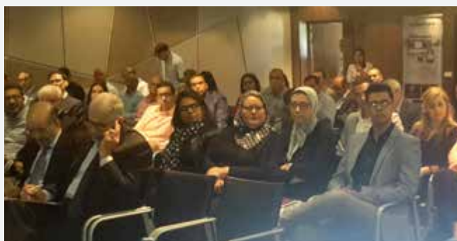
> Fès <